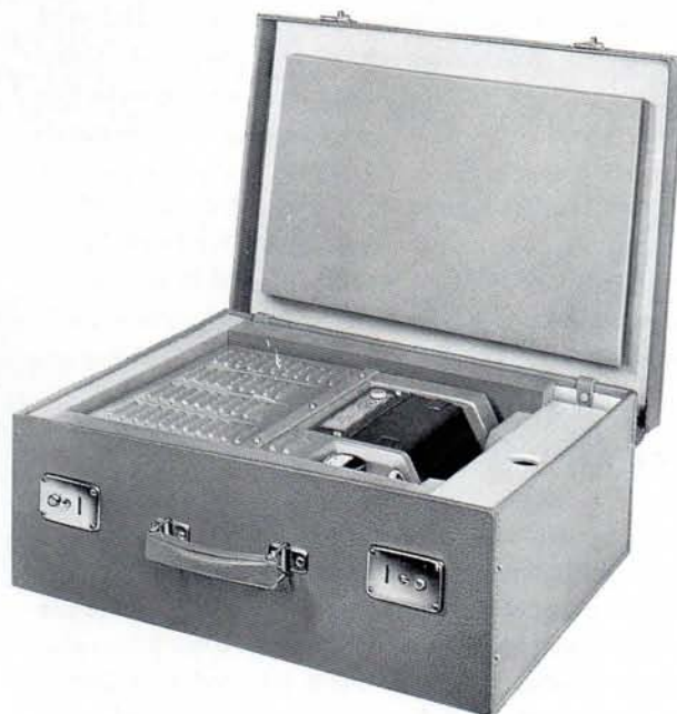
Tragbarer HELL Telebildsender TS 975 in gepolstertem Lederkoffer 2008 a